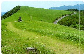
「川内峠」 まるで天上を歩いて いるような爽快な道。