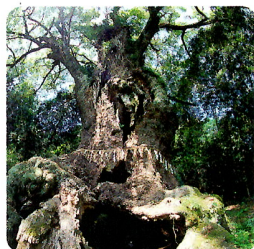
「武雄の大楠」 樹齢3000年以上。 武雄神社のご神木。