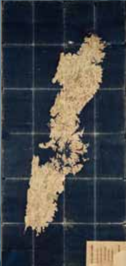
쓰시마국 겐로쿠국 두루마리 (소케(宗家)문고·나가사키 현립 쓰시마 역사민속자료관 소장)