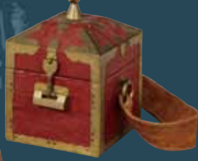
쓰시마 번주 [소 요시야야(宗義章)] 국서 (소케(宗家)문고·나가사키 현립 쓰시마 역사민속자료관 소장)