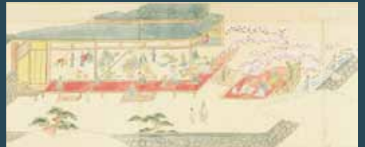
조선도 그림 [부분]