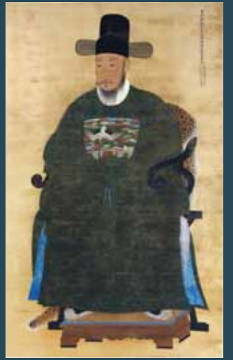
반국 이덕성 초상(부산박물관 소장) [한글 부록] 해의 초출품