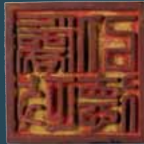
「위정이덕」 도장 (규슈 국립박물관) [국지정 중요문화재]