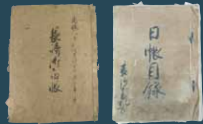
좌 : 나가사키 계장 우 : 일장목록 (소케(宗家)문고·나가사키현립 쓰시마 역사민속자료관 소장) [국지정 중요문화재]

10만석 격 부사로서 에도시대를 산 쓰시마번 소케(宗家). 쓰시마·나가사키·에도·조선 부산에 걸친 국제교류를 이끌었습니다. 에도시대의 조일 외교는, 12회에 걸쳐 조선통신사가 내일하고, 그 도중에서는 화려한 행렬과 함께 문화교류도 깊어졌습니다. 그 뒤에서 쓰시마번 소케는 외교의 실무를 맡아 국교회복 교섭부터 에도시대를 통해 외교·무역을 전개하고, 양국의 관계 유지에 힘썼습니다. 또한, 동아시아 세계의 창구였던 나가사키와 쓰시마번은 무역과 교류민의 대응을 둘러싸고 깊은 관계가 있었습니다. 바다를 통해 나가사키·쓰시마·부산은 강하게 이어져 있던 것입니다. 지난 2012년에 나가사키 현립 쓰시마 역사민속자료관 소장의 소케문고 자료가 중요문화재로 지정된 것을 기념하여 국내에 전례하는 쓰시마번 소케관계 자료의 일품(逸品)을 소개합니다. 국내외에 남아있는 12만 점에 달하는 소케문서에서 엿보는 쓰시마번 소케의 광채를 꼭 보시길 바랍니다.