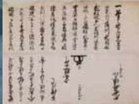
「쓰시마번 11대 번주 소 이사부로 (宗猪三郎) 가 나가사키 부교 구제 히로타미 (久世広民) 앞으로 보낸 문서」 (당관 소장)