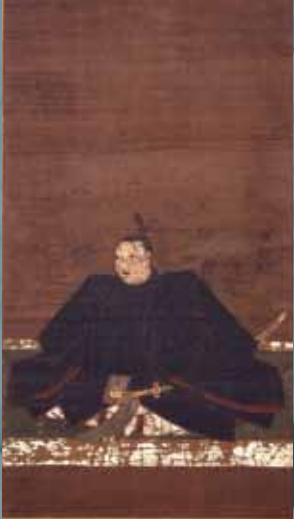
반소인 진(萬松院殿)(쓰시마번 초대번주 [소 요시토시(宗義智)] 상 (반소인 소장)