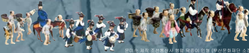
문미순 제작 조선통신사 행렬 덕중이 인형 (부산문화재단 소장) 해의 초출품