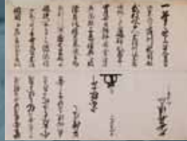
「対馬藩11代藩主宗猪二郎より 長崎奉行久世広民宛書付」(当館蔵)