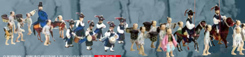
文美順制作 朝鮮通信使行列紙人形(釜山文化財団蔵) 海外初出品