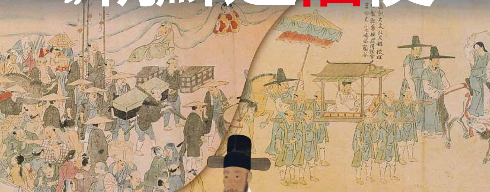
延享年間朝鮮来聘使図(部分) (大阪府立中之島図書館蔵)