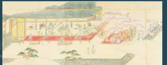
朝鮮図絵[部分](京都大学附属図書館蔵)