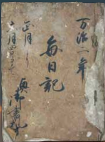
毎日記 奥書札方(宗家文庫・長崎県立対馬歴史民俗資料館蔵)