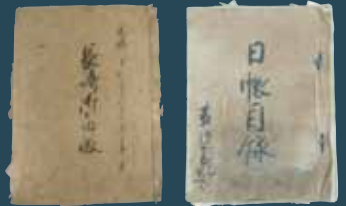
左:長崎御届帳 右:日帳目録 (宗家文庫・長崎県立対馬歴史民俗資料館蔵) [国指定重要文化財]

このたび、平成24年に長崎県立対馬歴史民俗資料館所蔵の宗家文庫資料が国の重要文化財に指定されたことを記念し、国内に伝来する対馬藩宗家関係資料の逸品をご紹介します。国内外に残る12万点におよぶ宗家文書からうかがえる、対馬藩宗家の輝きをぜひご覧ください。