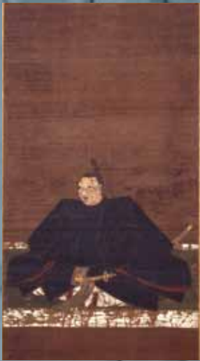
萬松院殿(対馬藩初代藩主 宗義智)像 (万松院蔵)