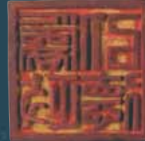
「為政以德」印(九州国立博物館蔵) [国指定重要文化財]