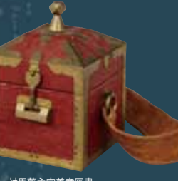
対馬藩主宗義章圖書 (宗家文庫・長崎県立 対馬歴史民俗資料館蔵)