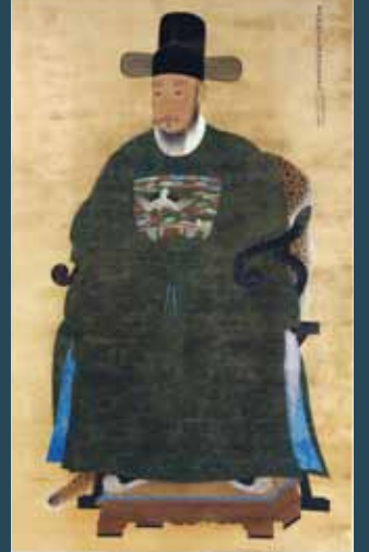
盤谷 李徳成肖像(釜山博物館蔵) [韓国宝物] 海外初出品